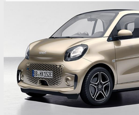
smart EQ fortwo pulse

passion. Ogni smart è qualcosa di speciale. E se ti piace ancora più ricca, la passion è quella perfetta per te.