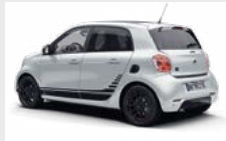
smart EQ forfour edition one