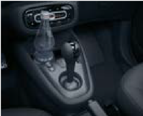
Console centrale con copertura e bracciolo centrale nella parte anteriore (pieghevole) (J59)

La passion (DL3) distingue la tua smart, esteticamente e tecnologicamente. I tessuti a rete e il nuovo design della seduta, insieme alle doppie cuciture conferiscono agli interni un aspetto di valore.