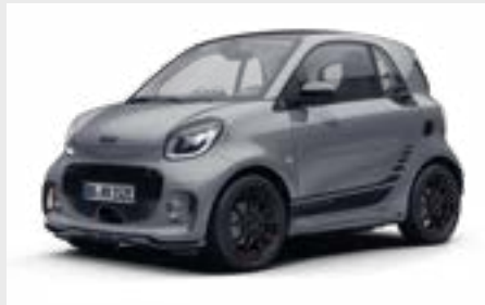
smart EQ fortwo edition one