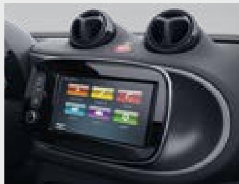
smart Media-System (535)