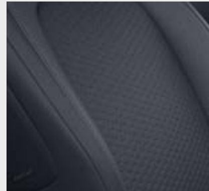
Plancia e pannello centrale delle porte in tessuto nero e rivestimento in nero / grigio (54U)