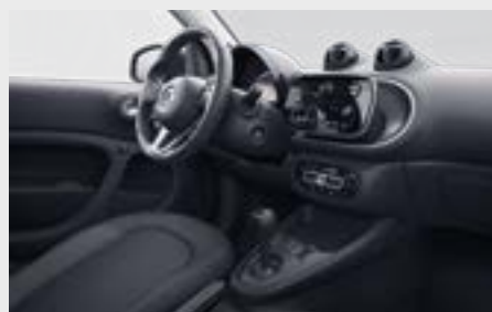
passion/pulse di serie

plancia e pannello centrale delle porte in tessuto nero e rivestimento in nero / grigio (54U)