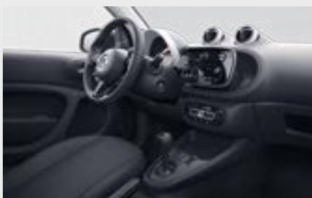
pure di serie

plancia e pannello centrale delle porte in tessuto nero e rifiniture in bianco (50U)