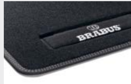
tappetini in velluto BRABUS