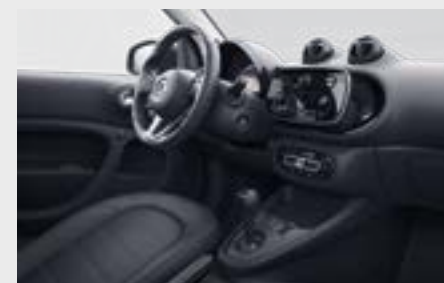
prime di serie

plancia e pannell centrali delle porte in tessuto nero e rivestimento in nero (61U)