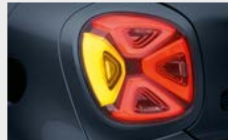
fari full LED posteriori (K32)