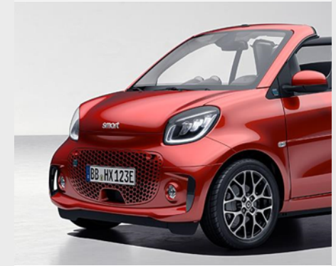
smart EQ fortwo prime

pulse. L'impulso sportivo parte con la pulse: cerchi in lega leggera da 40,6 cm (16") ed equipaggiamenti sportivi.