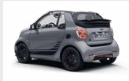
smart EQ fortwo cabrio edition one