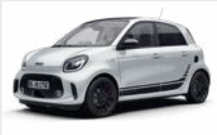
smart EQ forfour edition one