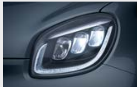
fari full LED anteriori (K32)