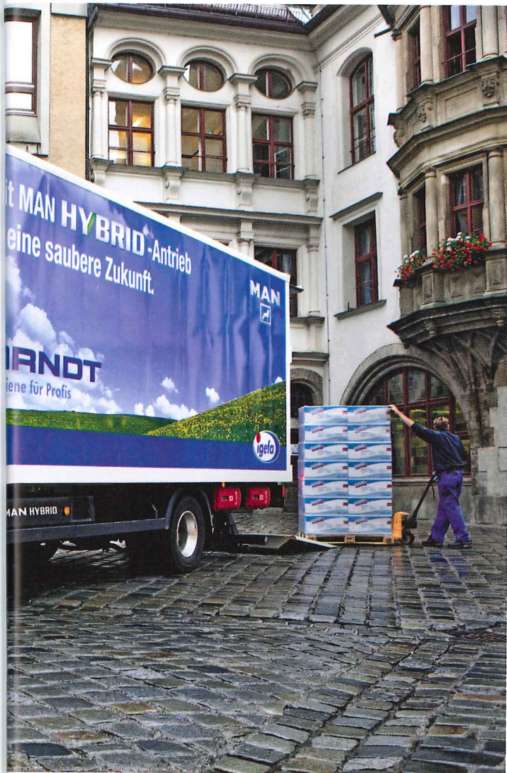
Carico e scarico nel centro di Monaco: il TGL ibrido attraversa pressoché senza alcun rumore la zona pedonale.

(162 kW) i TGL ibridi sono equipaggiati in modo ottimale per il trasporto urbano. Ma mentre finora in frenata l'energia cinetica veniva dissipata in calore, il TGL ibrido la utilizza per caricare le batterie agli ioni di litio. In fase di spunto l'energia frenante accumulata avvia il motore elettrico (v. riquadro a sx). In sosta al semaforo interviene un comodo sistema automatico di accensione e spegnimento del motore: il motore diesel si spegne, al minimo non consuma carburante e non rilascia inutili emissioni. Al verde, il motore riparte al rilascio dei freni. Il veicolo parte esclusivamente in modo elettrico, riducendo così notevolmente i consumi allo spunto.